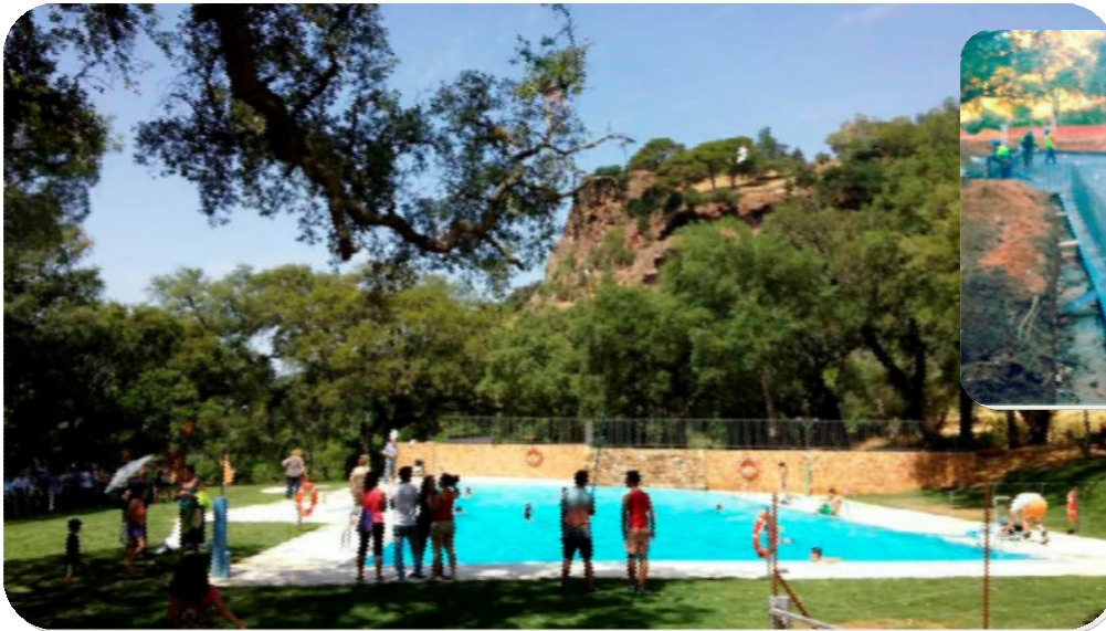
LAGUNA ARTIFICIAL PARA BAÑOS PUBLICOS Alajar (Huelva)

Promotor: AYUNTAMIENTO DE ALAJAR Ubicación: Alajar (Huelva) Importe: 354.000,00€ Fecha de finalización: 31/03/2014