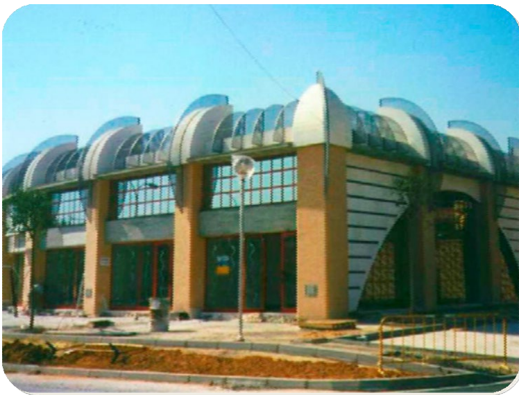
CENTRO COMERCIAL "LOS DESCUBRIMIENTOS TIENDA" Mairena del Aljarafe (Sevilla)

Promotor: SODEFESA Ubicación: Mairena del Aljarafe (Sevilla) Importe: 620.290,00€ Fecha de finalización: 31/10/1995