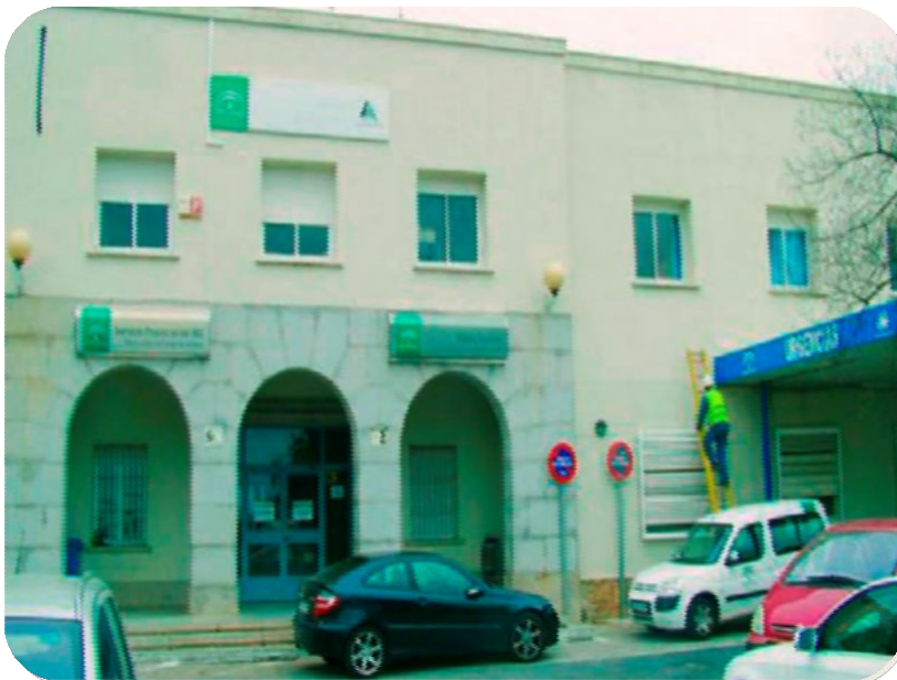
REFORMA PARA EL CENTRO DE APOYO AL DIAGNOSTICO (HOSPITAL MANUEL LOIS) Huelva

Promotor: EMPRESA PUBLICA DE EMERGENCIAS SANITARIAS Ubicación: Huelva Importe: 467.549,00 € Fecha de finalización: 30/09/1997