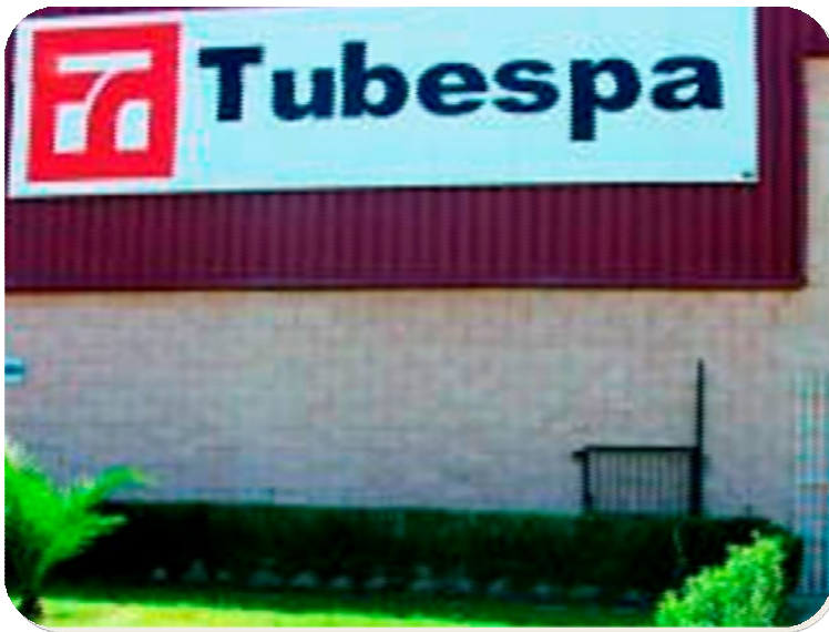
PROYECTO DE AMPLIACION DE INSTALACIONES NAVE TUBESPA Riotinto (Huelva)

Importe: 621.378,00 € - 346.965,00 € Fecha de finalización: 31/12/1995 - 30/12/2000