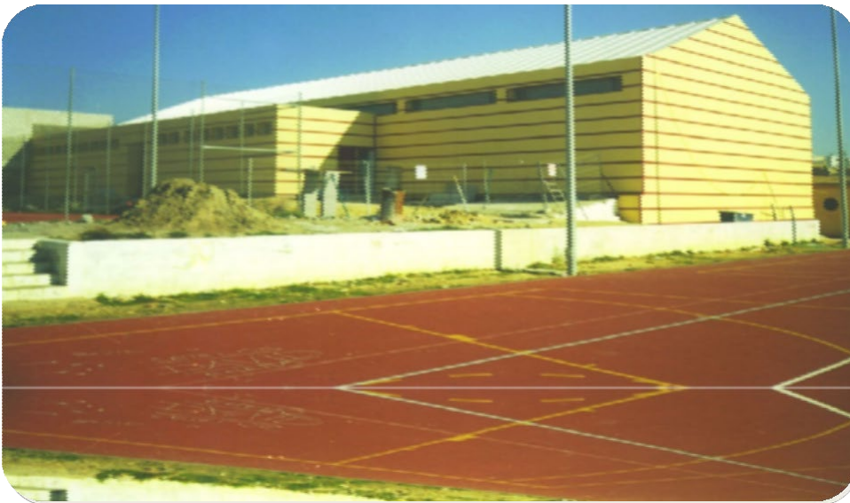
GIMNASIO Y VESTUARIOS EN LA ZONA DEPORTIVA PABLO VI-LOS CARAMBOLOS Alcalá de Guadaira (Sevilla)

Promotor: AYUNTAMIENTO DE ALCALÁ DE GUADAIRA Ubicación: Alcalá de Guadaira (Sevilla) Importe: 335.191,00€ Fecha de finalización: 30/01/2001